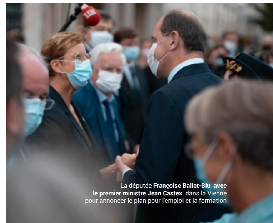
La députée Françoise Ballet-Blu avec le premier ministre Jean Castex dans la Vienne pour annoncer le plan pour l'emploi et la formation